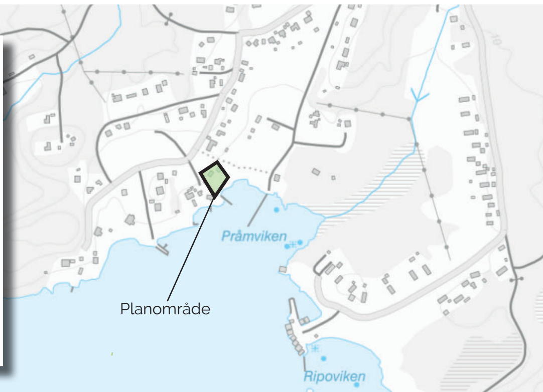
Planområdets lokalisering och avgränsning markerad.