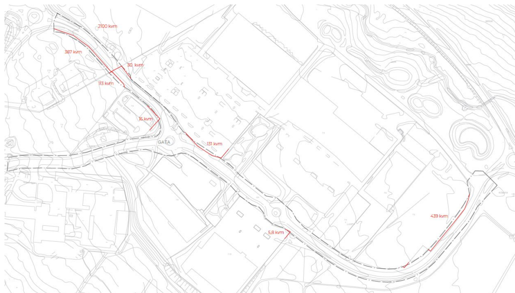
Figur 1: Diagram över planens fastighetspåverkan.